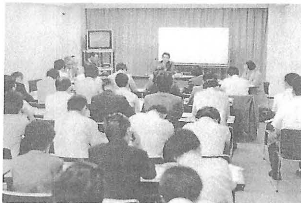
九州個別化研究会の事務局 久原小へ

昨年は、大会テーマ「個別化教育は、教育活性化の主役になりうるか」をもとに、九州・沖縄各県の実践報告を中心とした研究会(全個連会報第8号で報告)と、年2回の会報発行、年度末の研究紀要の発刊を行い、研修の充実と組織の拡大に励んで来ました。