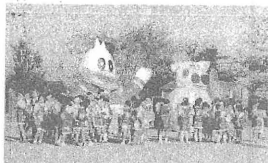
おがわっ子フェスティバル'91