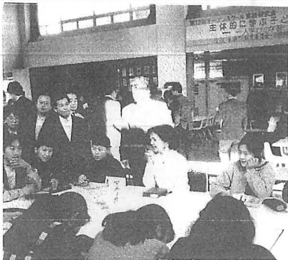
6年 社会 アメリカの話聞く

「問題解決学習」での熱心な取り組みを臉に残しつつ、フッと「発言したほうがよいのでは」といつもの思考パターンが頭をかすめました。いままで何ら疑問に思わなかった学習のスタイルも「子どもの側」からとらえ直す目を持つと「わかる」という事ひとつをとっても教師の思い込みとは相当なズレがあるように思いました。こんな揺さぶりをかけられた1日でした。(加藤久)