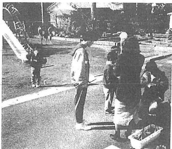
1年 生活科 ふゆとあそぼう

このような充実した1日を提供して下さった、大磯小の先生方に感謝の気持ち一杯に帰路につく楽しい1日でした。(多田)